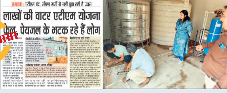
लाखों की वाटर एटीएम योजना फेल, पेयजल के मटक रहे हैं लोग